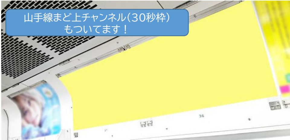
掲出エリアイメージ