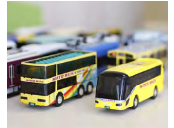
自社開発の玩具「オリジナルサウンド」シリーズ